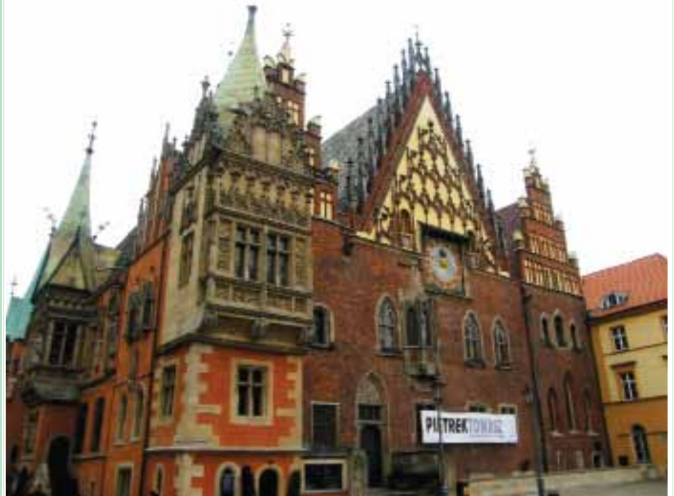
На фото - Ратуша у Вроцлаві