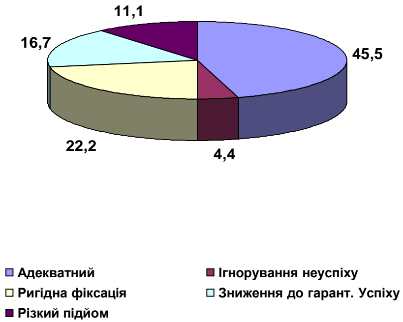
Рис. 2.4. Процентне співвідношення груп студентів з різним характером РП (у %).